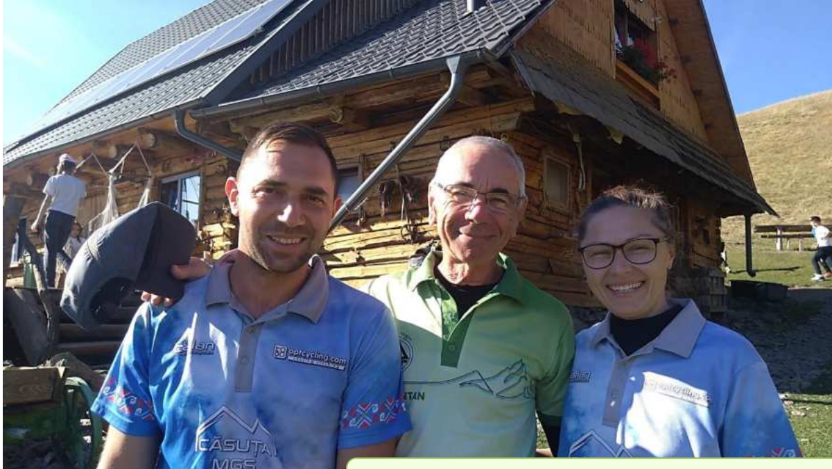
Ghidul și gazdele noastre. Munții Cindrel, 23 octombrie 2024